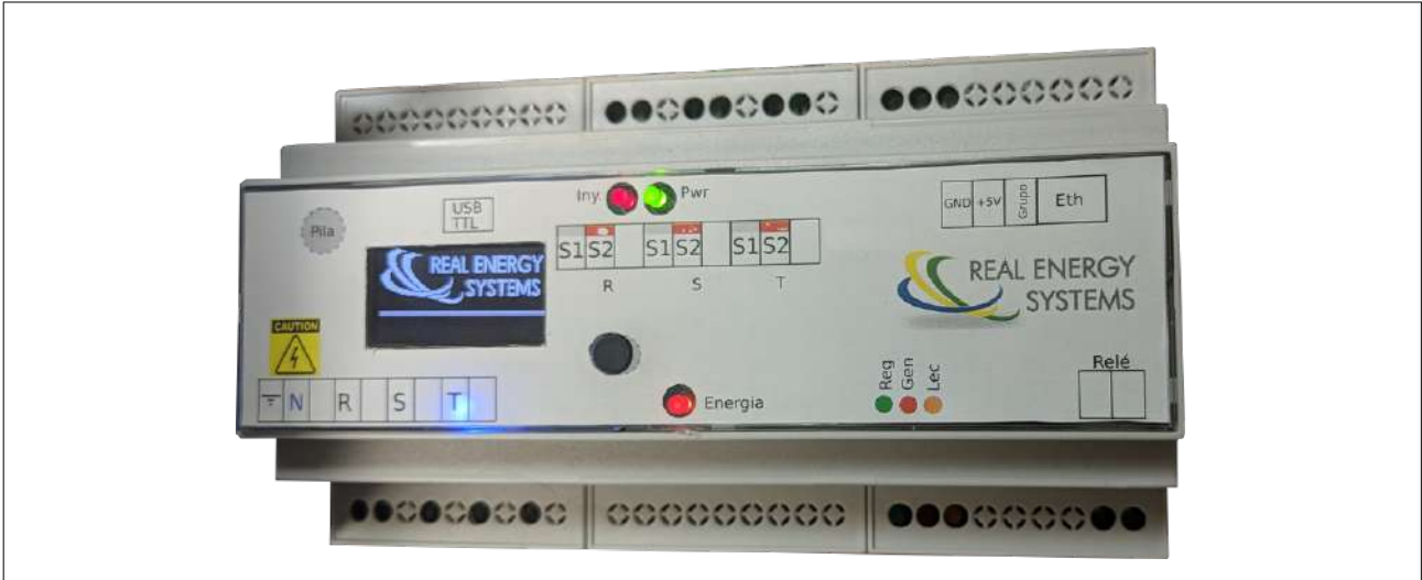
Figura 1 PRISMA 310A - un controlador dinámico de potencia con inyección CERO compacto

Con cumplimiento de los criterios de la UNE 217001-IN y RD 244/2019